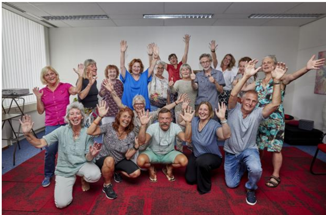
Een deel van de vrijwilligers